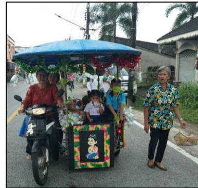
แห่จาดเดือนสิบ