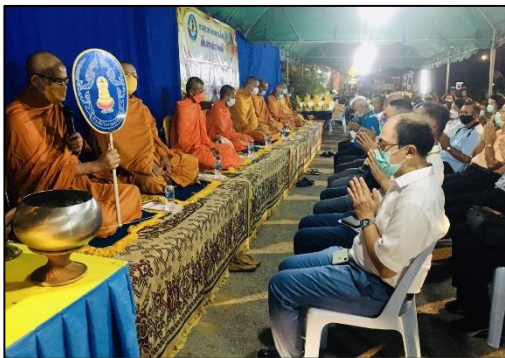
ชักพระสวดตลาด