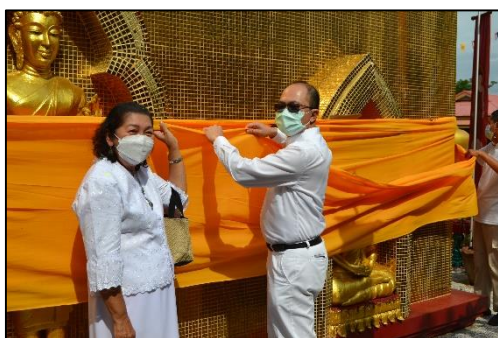
แห่ผ้าห่มพระธาตุ