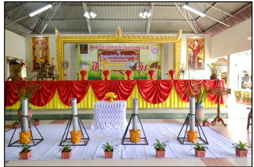
หล่อเทียนพรรษา