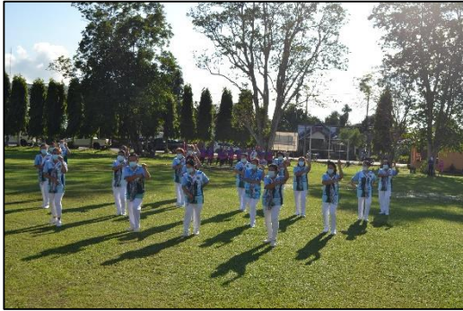
ระบำกรีดยาง